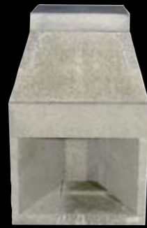
28" med 2 sidestykker H: 1281 x B: 826 x D: 710