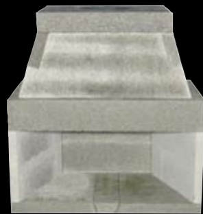
42" med 2 sidestykker H: 1281 x B: 1230 x D: 710