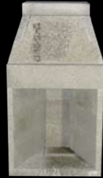
28" med 3 sidestykker H: 1521 x B: 826 x D: 710