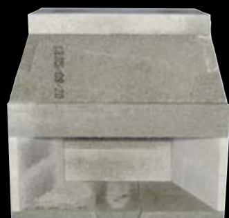
48" med 2 sidestykker H: 1281 x B: 1346 x D: 710