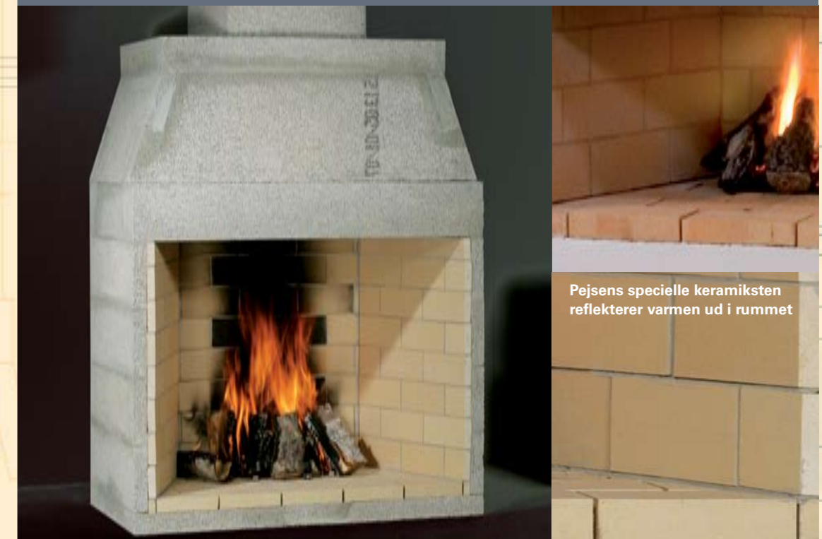
Pejsens specielle keramiksten reflekterer varmen ud i rummet

En KINGFIRE-pejs er resultatet af mange års forskning. Resultatet er en række pejsemoduler produceret i verdens mest velegnede materialer i en optimal konstruktion. Med KINGFIRE får du en pejs med maksimale brand- og