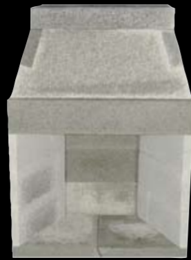
36" med 3 sidestykker H: 1521 x B: 1090 x D: 710