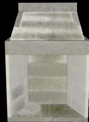
42" med 4 sidestykker H: 1761 x B: 1230 x D: 710