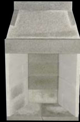
36" med 4 sidestykker H: 1761 x B: 1090 x D: 710