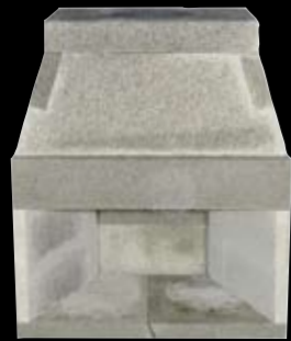
36" med 2 sidestykker H: 1281 x B: 1090 x D: 710