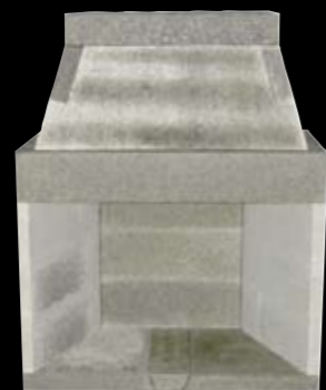
42" med 3 sidestykker H: 1521 x B: 1230 x D: 710